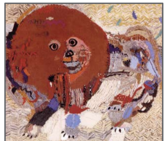
Sten Kauppi "Lejonhunden" (detalj), 1986

Öppet: torsdag-söndag kl 12-16 Julöppet: 26-30/12, 1-6/1 kl 12-16