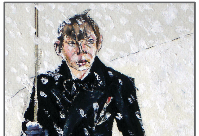
Bror Hjorth "Självporträtt" (detalj), 1913