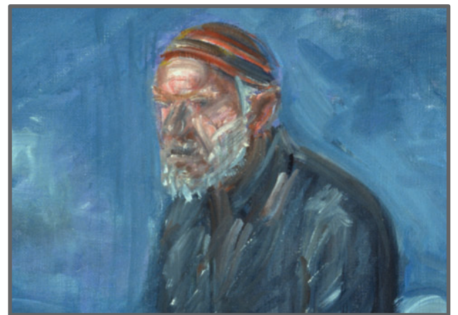
Alvar Jansson "Självporträtt till häst" (detalj), 1981

Visning av huset och samlingarna tors & sön kl 14. Kort visning av museet och tillfällig utställning: fre kl 14. Visning av tillfälliga utställningar, se museets hemsida. Söndagsverkstad med familjevisning 1:a söndagen i varje månad. Babyvisning (visning för föräldralediga): fre 1/2, 14/3, 11/4, 16/5, 22/8 kl 13.