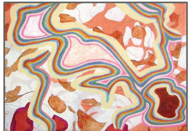
Pelle Perlefelt "Momentum III" (detalj), 2005