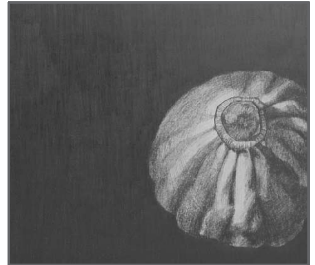
Hertha Hansson "Hjärteklumpen ensam i jorden" (detalj), 2008

Föredrag, konserter, familjedag, verkstad och visningar i samarr med Studieförbundet. Aktuellt program och mer information finns på www.brorhjorthshus.se .